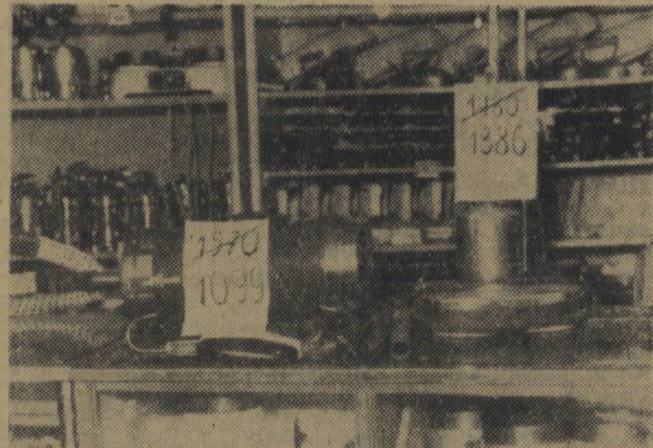
Dużą różnicę widzimy w cenie odkurzacza i froterki (na zdjęciu). Przed obniżką odkurzacz kosztował 1 370 zł, obecna cena jego wynosi 1 099 zł, cena froterki obniżona została z 1 360 zł na 1 336 zł.

Praca przy przecenieniu towarów we wszystkich sklepach