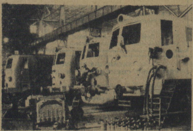
T RZECIA część globalnej produkcji Fabryki Lokomotyw i Urządzeń Elektrycznych im. Hansa Beimlera w Henningsdorf (NRD) jest przeznaczona na eksport do krajów demokracji ludowej, Chin i krajów kapitalistycznych (Szwecja, Finlandia, Holandia, Dania itp.). W myśl umowy z Polską Rzeczpospolitą Ludową zakłady dostarczają wagonów motorowych dla polskich kolei elektrycznych oraz lokomotyw dla pociągów pospiesznych. Na zdjęciu: elektrowozy dla Polski.

Nie ma to jak altruistyczne instynkty kapitalistów. Z obrzydzeniem myślą o pokoju, a do szczęścia wystarczy im wojna. Nie potrzebują im ani chleba, ani ziemi, a wystarczy cyferka z kilkoma przynajmniej zerami na koncie bankowym. MAT.