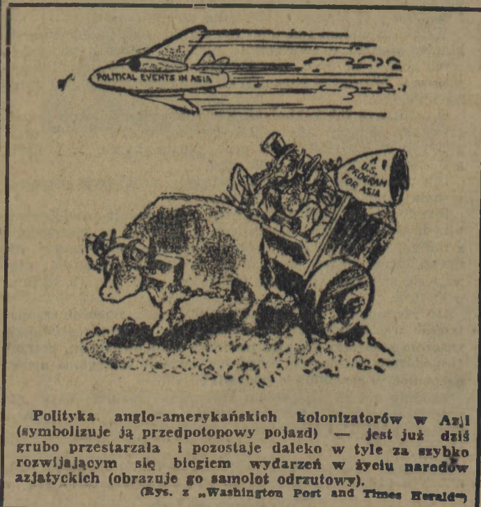
Polityka anglo-amerykańskich kolonizatorów w Azji (symbolizuje ją przedpotopowy pojazd) — jest już dziś grubo przestarzała i pozostaje daleko w tyle za szybko rozwijającym się biegiem wydarzeń w życiu narodów azjatyckich (obrazuje go samolot odrzutowy).

Do późnych godzin wieczornych po obydwu stronach Odry płonęły ogniska, płynęły dźwięki polskich i niemieckich piosenek. Manifestowano na cześć przyjaźni obu narodów, wspólnej walki o pokój, przeciwko odrodzeniu nowego Wehrmachtu, o zjednoczenie narodu niemieckiego.