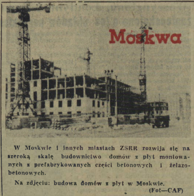
W Moskwie i innych miastach ZSRR rozwija się na szeroką skalę budownictwo domów z płyt montowanych z prefabrykowanych części betonowych i żelazobetonowych.

Każdy z roztopioną stalą przejeżdża teraz w drugą stronę halli. Stal zostaje rozlana do form.