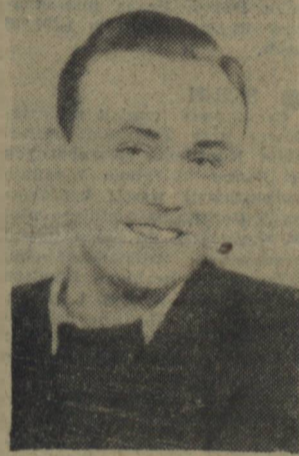
Znają go tam dobrze, a co najważniejsze — lubią i cenią. W Stawnicy, Krajenc, Gronowie czy Zakrzewie, młodzież mówi o nim jako o SWOIM — przewodniczącym, który zna jej troski, życzenia i pragnienia.