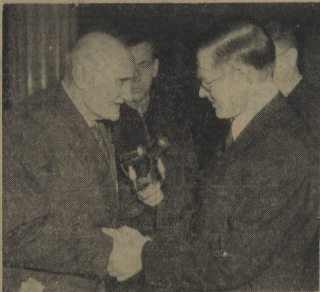
22 stycznia 1955 roku w 50 rocznicę rewolucji 1905 roku odbyła się w Radzie Państwa w Warszawie uroczysta dekoracja uczestników rewolucji wysokimi odznaczeniami państwowymi. Dekoracji dokonał