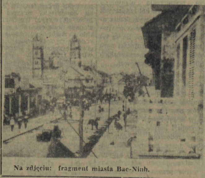
Na zdjęciu: fragment miasta Bac-Ninh.