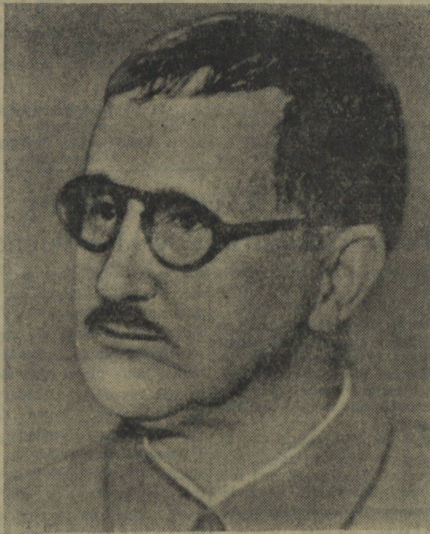
BERTOLD BRECHT — znany poeta i dramaturg niemiecki, zdecydowany przeciwnik wtrącenia niemieckiego militarysty. Brecht bierze czynny udział w budowie nowego życia w Niemieckiej Republice Demokratycznej.