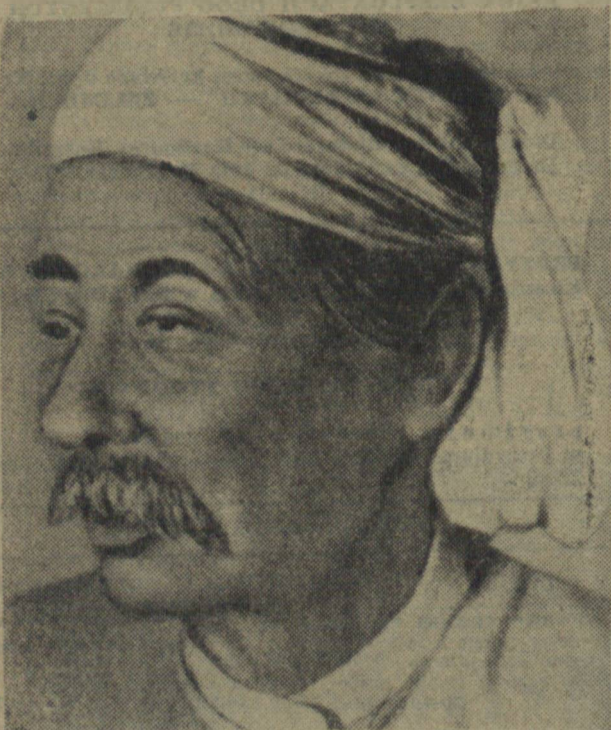
THAKIN KODAW HMAING — działacz społeczny Bury, pisarz, historyk, filozof, weteran walki narodowo-wyzwoleńczej narodu burmańskiego.