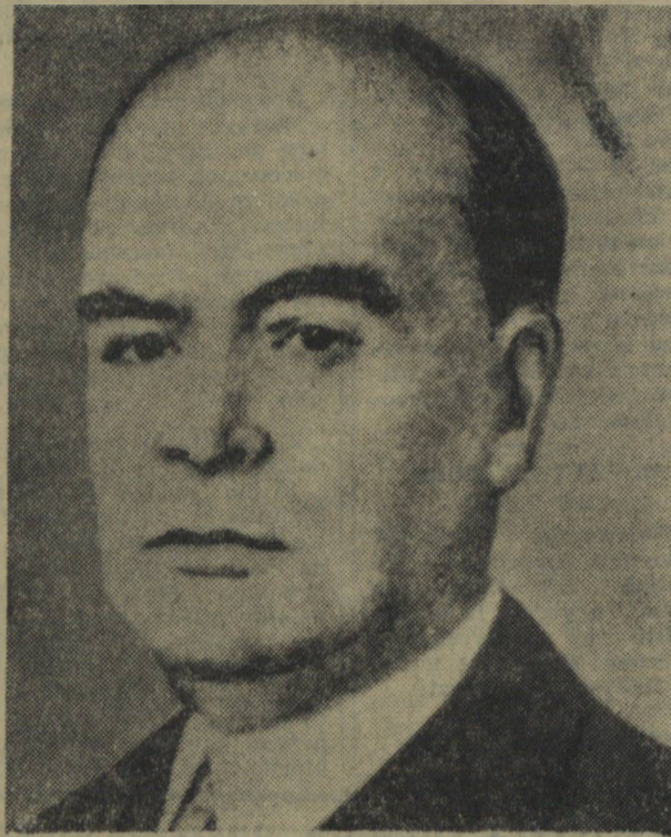
BALDOMERO SANIN CANO — wybitny uczyony i znany działacz polityczny Kolumbii, profesor, doktor honoris causa uniwersytetów w Edynburgu i Bogocie.