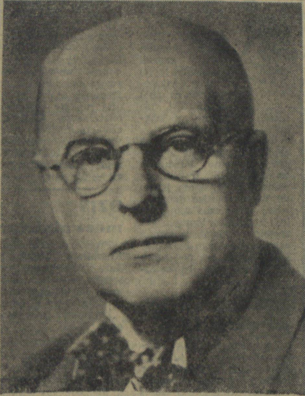
DENNIS NOWELL PRITT — prawnik angielski, znany działacz społeczny i wybitny publicysta, przewodniczący Międzynarodowego Zrzeszenia Prawników Demokratów. Znane są zasługi Pritta jako demaskatora niemieckich zbrodniarzy wojennych. W broszurach o wojnie w Korei ujawnił on prawdziwe sprężyny wydarzeń koreańskich.

za wybitne zasługi w walce o utrzymanie i utrwalenie pokoju, otrzymali w roku 1954 następujący bojownicy o pokój i przyjaźń między narodami: