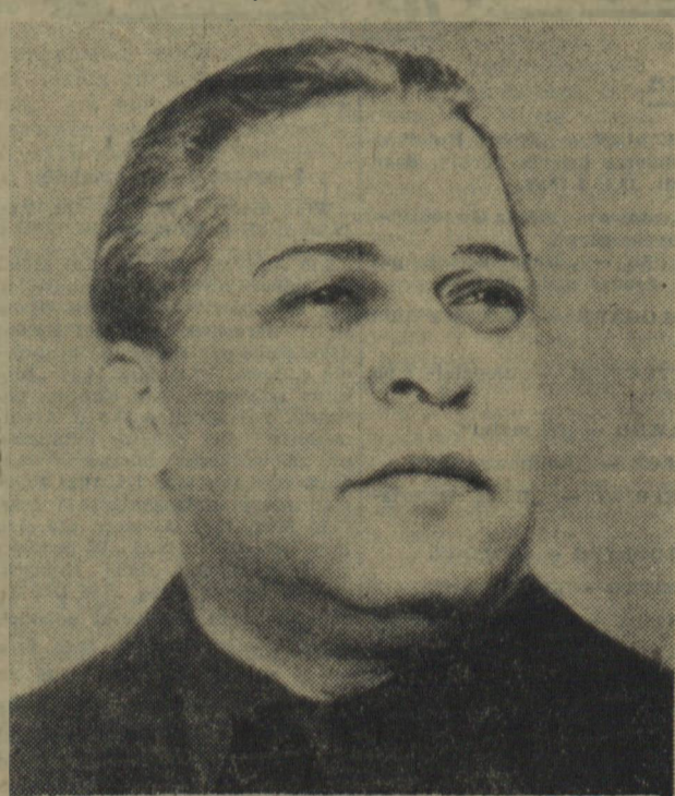
NICOLAS GUILLEN — wybitny poeta kubański, znany działacz społeczny i publicysta. Guillen aktywnie walczy przeciw uciskaniu narodów Ameryki Łacińskiej przez imperializm amerykański, wzywa do walki o niezawisłość narodową, o pokój i demokrację.