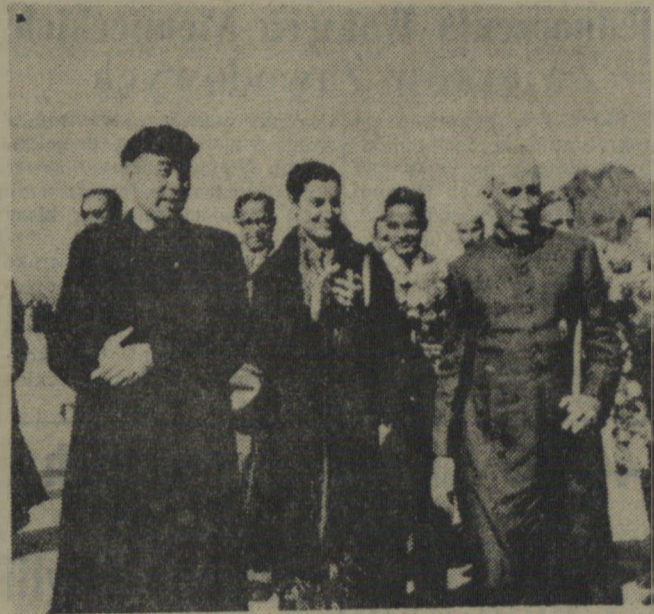
Premier Indii Nehru przybył 19 października br. na zaproszenie rządu Chińskiej Republiki Ludowej do Pekinu. Na zdjęciu: na lotnisku pekińskim. Od lewej: premier Czu En-lai, Indira Gandhi (córka premiera Nehru) i premier Nehru.