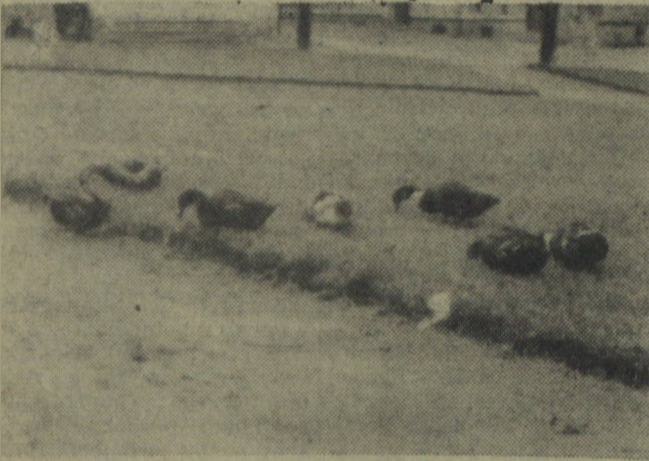
A oto znów inny koszaliński obrazek. Tym razem kaczki pasące się na skwerku na placu Kilińskiego.