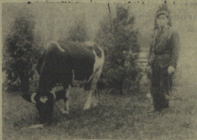
Jest to zdjęcie wykonane przez naszego fotoreportera nie w jakimś PGR, czy spółdzielni produkcyjnej, ale... w parku Przyjaźni Polsko - Radzieckiej w Koszalinie. Komentarze są tu zbędne. Należy tylko zapytać właściciela tej zabudowanej z apetytem trawki krówki, czy i nadal ma zamiar paść ją na trawnikach parku.