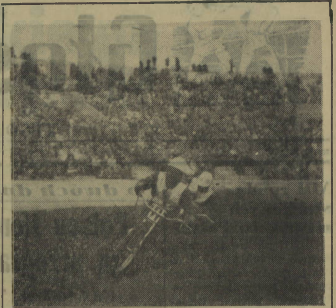
Na torze żużlowym „Rudolowych” w Warszawie odbyła się w dniu 17.X.54 r. płyta i ostatnia eliminacja indywidualnych mistrzostw Polski na żużlu — mistrzem Polski został Polukord. Na zdjęciu: fragment eliminacji.

W jaskrawej sprzeczności z tymi faktami stoją inne, niestety liczniejsze przykłady. W rozmiarach tłumaczy się brakiem kredytów.