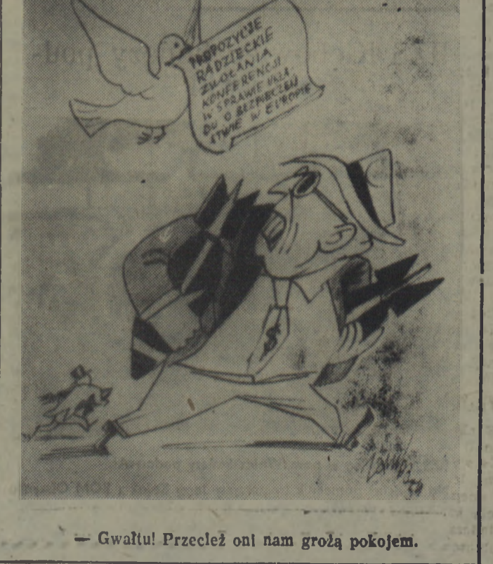
— Gwałtu! Przecleż on nam grozą pokojem.