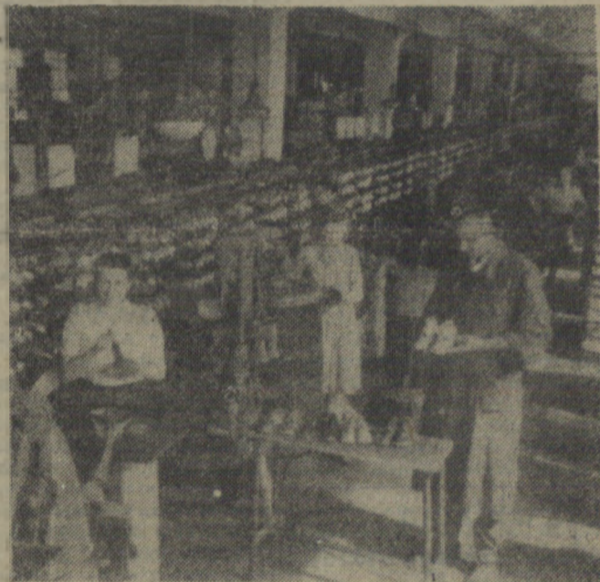
Słaskie Zakłady Obuwia w Otmęcie produkują między innymi różne fasony obuwia dziecięcego.