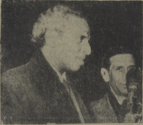
Na zdjęciu: stały delegat Indii w ONZ Kriszna Menon w czasie swego pobytu w Genewie.