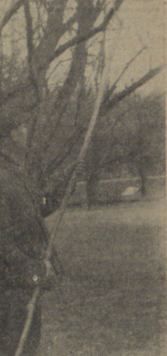
naszą ziemię”. Hasło to rzucone przez dzieci ze szkoły podstawowej z Bożnowa, woj. zielonogórskiego, podjęte przez drużyny harcerskie z różnych województw.

O dokładnym terminie egzaminu wstępnego, który odbędzie się w czerwcu br., kandydaci zostaną powiadomieni listownie przez właściwą Komendę Oficerskiego Technikum Pożarniczego.