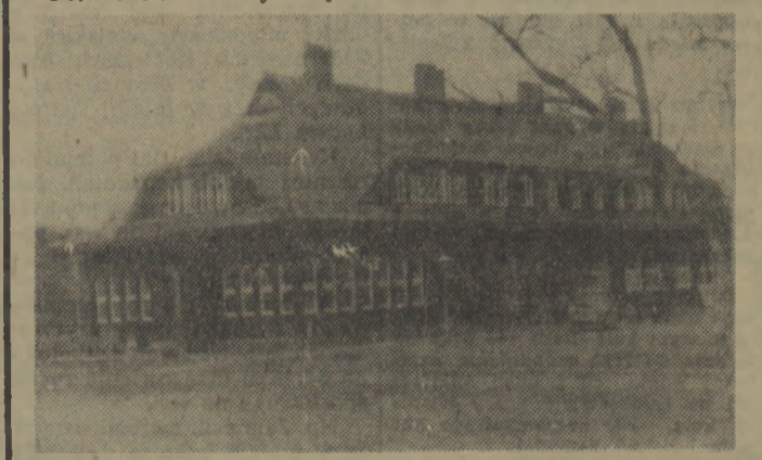
...budynek mieszkalny otrzymał toaletę zewnętrzną i wewnętrzną. Charakterystyczny dla wałęckiego ośrodka słomiany dach budynku został całkowicie odnowiony...

wierzechni z próchnicy, które w pobliżu, w lesie, jest bardzo dużo. W ten sposób bieżnia będzie jeszcze bardziej elastyczna — mówi dalej Madziński.