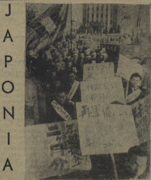
Wielu 35 tysięcy robotników w Tulu, należących do 50 związków zawodowych. Uczestnicy wiecu występowały w obronie pokoju i dali podwyżki płac.

KOMITET CENTRALNY POLSKIEJ ZJEDNOCZONEJ PARTII ROBOTNICZEJ