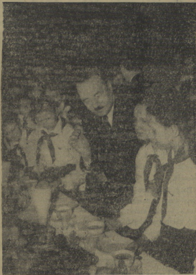
W dniu 6 stycznia 1954 roku kilkaset dzieci — przodowników nauki i pracy społecznej z całego kraju przybyło na zaproszenie Prezesa Rady Ministrów Bolesława Bieruła na uroczystość choinki noworocznej do Urzędu Rady Ministrów w Warszawie.