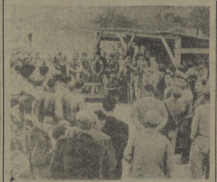
Na zdjęciu: wiec robotników budowlanych w Montreuil przeciwko „armii europejskiej”.