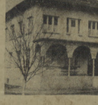
W Bułgarskiej Republice Ludowej mieszkańcy wsi, przed wojną pozbawieni niemal całkowicie opieki lekarskiej.

Władza ludowa podjęła energiczną walkę z zacofaniem wsi bułgarskiej.