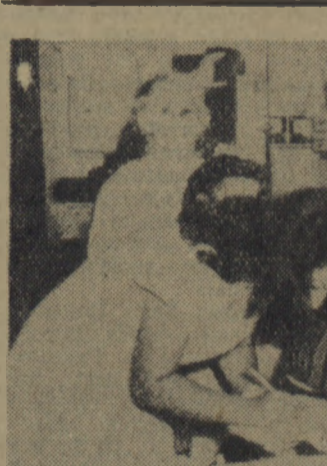
Z inicjatywy Federacji Demokratycznej Kobiet zorganizowano na Kuble akcję zbierania podpisów pod apelem w sprawie zakazu bomby atomowej. Na zdjęciu: Kobiety kubańskie podpisują apel.

● PRAGA Budowniczymi Wirskiej Elektrowni Wodnej odnieśli 15 listopada br. nowe zwycięstwo. Zakończono budowę zapory, w której ułożono 275 tys. m 3 betonu.