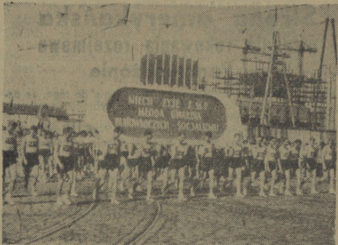
Na zdjęciu: Grupa sportowców ze Szkolnych Klubów Sportowych w pochodzie. (W głębi Pałac Kultury i Nauki im. Józefa Stalina).