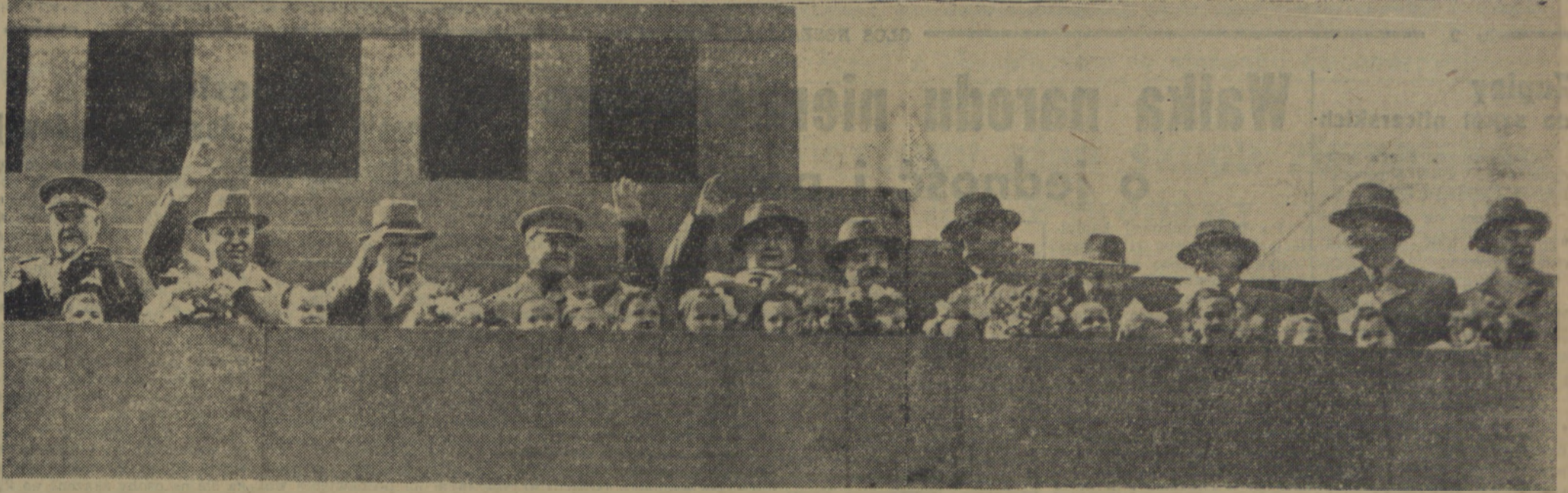
Na zdjęciu: Na trybunie Mauzoleum. Od lewej: — towarysze N. A. Bułganin, N. S. Chruszczow, K. J. Woroszyłow, G. M. Malenkow, Ł. P. Beria, W. M. Molotow, Ł. M. Kaganowicz, A. I. Mikołaj, M. Z. Saburow, M. G. Pierwuchin, N. M. Szwernik. Wraz z kierownikami Komunistycznej Partii Związku Radzieckiego i Rządu ZSRR znajdują się na trybunie dzieci, które wręczyły im kwiaty.