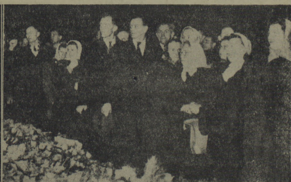
Lud Pragi u trumny Wodza narodu czechosłowackiego Klementa Gottwalda.