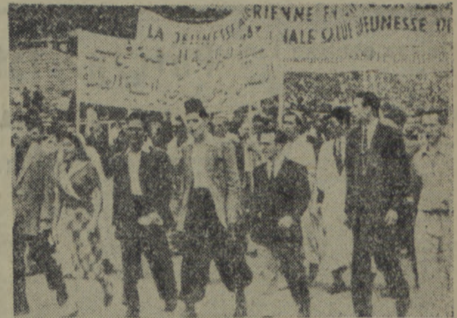
Delegacja młodzieży Algieru w podróży w czasie III Światowego Zjazdu Młodych Bojowników o Pokój w Berlinie.

daniem Międzynarodowej Konferencji w Obronie Praw Młodzieży jest nakreślenie drogi dalszej walki młodzieży o poprawę warunków bytu oraz walki w obronie pokoju.