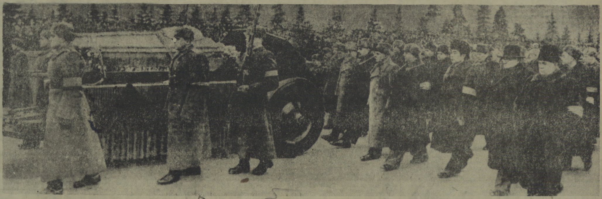
Moskwa. Pogrzeb Przewodniczącego Rady Ministrów ZSRR i Sekretarza Komitetu Centralnego Komunistycznej Partii Związku Radzieckiego, Generalissimusa J. W. Stalina.

PROLETARIUSZE WSZYSTKICH KRAJÓW ŁĄCZCIE SIĘ!