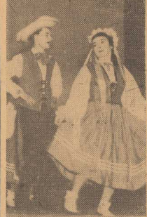
DZIARSKO tańczył „Kujawiaka” zespół artystyczny z POM-u w Łobezie. (Patrzenie na str. 2.)