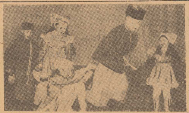
HURAGANAMI braw przy jego występiący na wojewódzkich eliminacjach Konkursu Pieśni i Tańca Radzieckiego — zespół dziecięcy Szkoły Zawrwa, za przesłany taniec „SNIEZKI”.

Ze świata * W BERLINIE odbyła się uroczystość wręczenia kluczy lokatom 148 mieszkań w nowych blokach, wybudowanych w Aleji Stalina. Mieszkańka otrzymała zaufanie przy budowie najpiękniejszej w stolicy Niemiec ulicy — czelwili robotnicy, inżynierowie, technicy oraz przedstawiciele inteligencji twórczej. * JAK DONOSI rozgłoszenia tokli ska, rząd japoński zamiera zastosować represje wobec delegatów japońskich, którzy brałi udział w Kongresie Narodów w Obronie Pokoju. Rząd japoński przygotował już nakazy aresztowania dziesięciu delegatów na Kongres po ich powrocie z Wiednia do Japonii. * JAK PODAJE agencja APN, 20 bm, przybył z Paryża do Bonn specjalny przedstawiciel amerykańskiego urzędu bezpieczeństwa wewnętrznego na Europe William Draper, aby w takich rozmowach z Adenauerem omówić plany uzbrojenia przyszłej zachodnio-niemieckiej armii najeźnej.