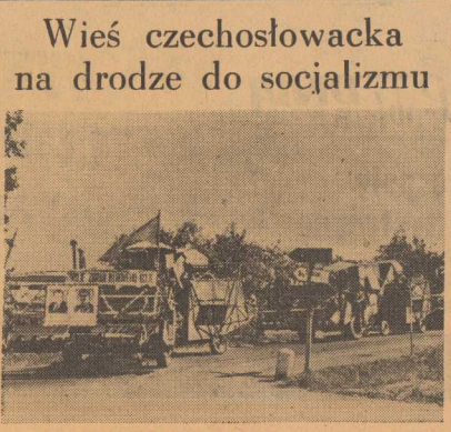
DZIEKI pomocy Związku Radzieckiego mechanizacja rolnictwa w Czechosłowacji podnosi się na coraz wyższy poziom. Na zdjęciu: radzieckie kombajny „S-4”, należące do jednego z czechosłowackich maszynowców.

PAŃSTWO LUDOWE otoczyło troskliwą opieką matkę i dziecko. Z roku na rok uruchamia się coraz więcej wiejskich ośrodków zdrowia. W chwili obecnej istnieje już ponad 500 izb porodowych o łącznej ilości