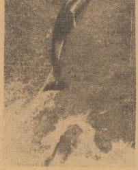
DELFINY chętnie tworzą szę stotkami, a jeszcze bardziej ławicami śledzi. Są nader zwinnie, a skoki ich dochodzą do kilku metrów.