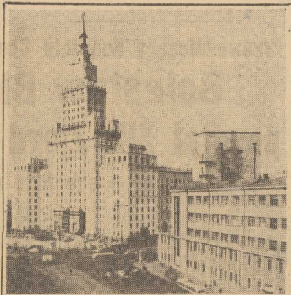
BUDOWA wieżowca Ministerstwa Komunikacji przy Czerwonych Wrotach w Moskwie.

Jest to nowa i niezłomna, zwiększająca i nieśmiertelna siła ideowa wielkiej epoki stalow- wej. Tylko międzynarodowy rewolucyjny ruch proletariatu i, tylko wielka nauka mark- sisowska-leninowska, rozwija się przez Stalina ku swym dzie- siątym szczytom osiągnię- ciom, które znalazły swój wy- raz w ostatnich pracach towa- rysza Stalina „Marksizm a za- gadnienia językownawstwa” i „Ekonomiczne problemy socja- lizmu w ZSRR” — prace, po- siadające olbrzymie znaczenie dla krajów socjalistycznej Polski produkujące już obecnie trzykrotnie więcej — niż przed