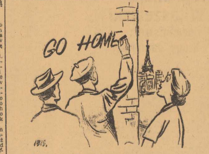
Francuska gazetka ścienna

Przedpójci na wybrzeżu kutra powrócił wczoraj w nocy do bazy przywożąc dwie tony ryby nadplanowo. Dzielną załogę osiągnięcie swe zadanie socjalistycznej opiece nad statkiem i sprzętem rybackim oraz systematycznej, ciągłej pracy z myślą o planie.