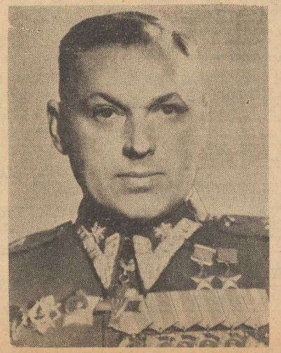
WOJSKO POLSKIE CZUJNIE STRZEŻE GRANIC POLSKI LUDOWEJ.

Minęła godz. 10. Rozlega się dźwięki hymnu narodowego. Przybywają, zajmując miejsca w prezydium, przedstawiciele rządu z PREMIEREM CYRANKIEWICZEM. (DOKOŃCZENIE NA STR. 2)