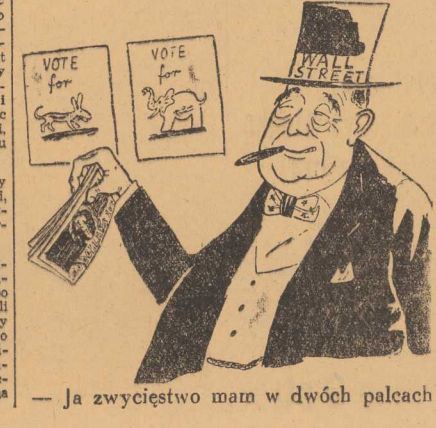
— Ja zwycięstwo mam w dwóch palcach