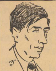
MITTELPUNKT, przew. Obw. Kom. Obr. Pokoju, prac. SPZB

WZYWAMY DZIAŁACZY RUCHU OBROŃCÓW POKOJU DO OFIARNEJ PRACY W KOMITETACH WYBORCZYCH FRONTU NARODOWEGO!