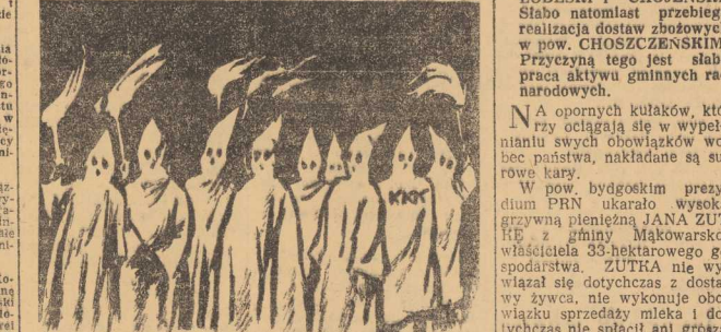
Amerkańskie białe noce