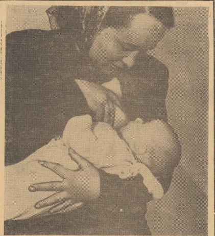
ODDAJĄC dziecko do żłobka, matka pozostaje tylko jeden obowiązek: karmienie pierśią. Dni w ciągu dnia matka odrzuca się od pracy i przychodzi do żłobka przy zakładowego.