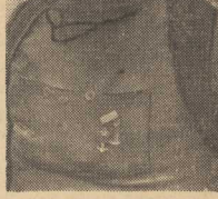
Wydawało się, że musi dokładnie zapamiętać każdy zakręt górskich stoków, każda bruzda, po której można byłoby wejść z Siatągą na wierzchołki gór, albo też zejść z nich do osiedla. Co sam obliczał w milczeniu, bez pośpiechu i zamykał oczy zupełnie jak gdyby notował w pamięci szkie miejscowości.

Później przesyły inne wyścigi, w których DRAŻKOWSKI walczył z wielokrotnymi reprezentantami Polski jak równy z równymi. Głównym jego celem był wyścig DOOKOŁA POLSKI. Przygotowywał się do niego, a że skutecznie, pokazał na pierwszy dzień 6-ciu etapach jadąc aż trzy z nich w zaszczytnej żółtej koszulce lidera. Nie spodziewana choroba uniemożliwiła Drazkowskiemu dal-