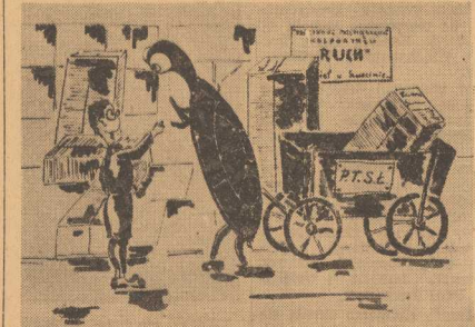
— Czy teraz Józio pracuje w „Ruchu”? — Tak jest.

PONIEDZIAŁEK 18 sierpnia 1952 r. Wład. g. 5.05, 6.30, 7.55, 12.04, 14.17, 21.55