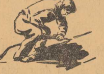
Rysunki FELIKS CIECHOMSKI

To prawdziwie cudo szczytowego budownictwa okrętowego niedługo zobaczymy kładące się na wodzie, gdzie stoczniovców czeka drugi etap pracy — wyposażenie nowej jednostki we wszystko to, co przetożycie kadłub w nowoczesny statek Polskiej Marynarki Handlowej. (9)