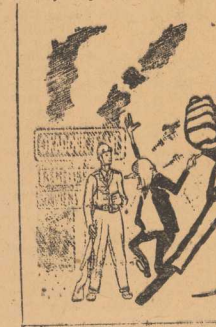
Naród francuski nie zapomni o Oradour sur Glane i innych miejscach...