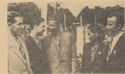
PIĄTKA MURARSKA z Nowej Huty zachwycona jest Szczecinem i jego energiczną młodzieżą. Goście z Nowej Huty podzieliли się z naszymi młodzieźcami, swoimi doświadczeniami w pracy. Przyjemnie upłynął czas na pogawędkach i wspólnej zabawie.

Na czterech rogach placu Konstytucji umiejscoszone zostaną tradycyjne w Warszawie stoiska z kwiatami.