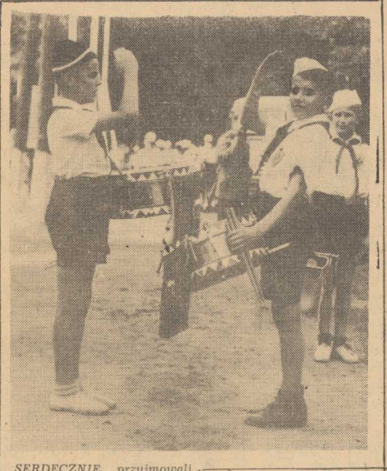
SERDECZNIE przyjmowali mieszkańcy Warszawy szczecińskich harcerzy...

CZWARTEK, 24 LIPCA 1952 R. NR. 176 (2321)