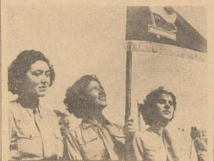
WYŚLEK młodzieży przy realizowaniu zobowiązań złotych...