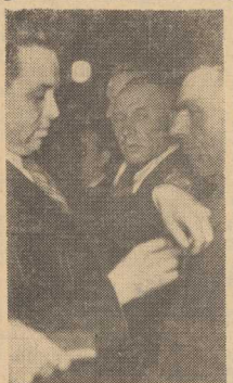
UROCZYSTEM momentem sesji WRN i MRN w Szczecinie w VIII rocznicę powstania Polskiej Ludowej było udekorowanie...