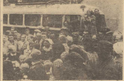
W ŁECZYCY , w powiecie starogardzkim, chłopcy z Sieradza i Rawy Mazowieckiej przekonali się, że jaki poziom wy-rasta gospodarka w spółdzielni produkcyjnej. Jak oszczędzają, góści z woj. centralnych witają dzieci.