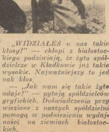
„WIDZIAŁES u nas takie kłosa?” — chłop z biłostockiego podziwiają, że żyto spółdzielcze w Kładowie już takie wysokie. Najważniejszy to jednak kłos.

— Jak wolno się takie żyto udaje?” — pytają spółdzielców gryfickich. Doświadczenia przywiązane z naszych spółdzielni pomogą w podniesieniu wydajności na ziemiach biłostockich.