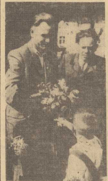
U NAS — za trzydziestostwo opomani krwiemi idzie jeszcze trzydziści — dzieci, pedząc je na pastwisku! — stwierdziłi chłopcy z biłostockiego. — U was na Pomorzu dzieci są weselsze i mądrejsze. Nie potrzebują ganiać za krowami. Uczą się, by w przyszłości jeszcze wyżej podnieść Wasze spółdzielcze gospodarki. I u was tak będzie — gdy za Waszym przykładem założymy spółdzielnie produkcyjne.

W Działowie gryfickim harcerze powitali delegatów chłopów biłostockich kwiatami i poinformowali ich o swych wynikach w szkole.