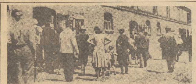
ZWIEDZAJĄC spółdzielnię pomorską, chłopcy z biłostockiego sprawdzili kasy szczygół. Szczególnie interesowało się hodowlą, ogładając np. szczygółko obory w RZS Klądkowo.

ZROZMÓW , które „Kurier” przeprowadził z mieszkańcami szczecińskich hoteli robotniczych widać, że spełniają one swą rolę, robotnicy są zadowoleni z mieszkań i opieki. Instytucje jednak, którym hotele robotnicze podlegają winny zawsze pamiętać o słowach Przewodniczącego KC PZPR Bolesława Bieruta gdy mówił on na VII Plenum o konieczności sprawnego i dobrego przyjęcia na miejscach pracy nowych robotników i o konieczności stałej, skutecznej nad nimi opieki. (go)