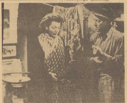
SCENA z filmu „Mury Malapagi”.