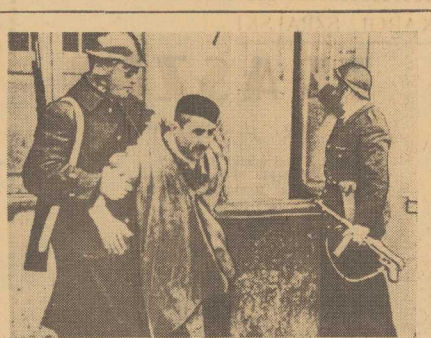
W TUNISIE trwa nadal napięta sytuacja. I kwietnia br. w całym kraju odbył się powszechny strajk na znak protestu przeciwko polityce kolonizatorów francuskich. Na zdjęciu: patrioci Tunisii zostają aresztowani i osadzeni w obozach.