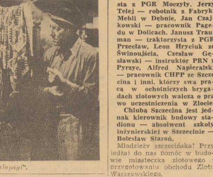
SCENA z filmu „Mury Malapagi”.

Postępowy reżyser „Murów Malapagi” Francis René Clemens, twórca „Bitwy o szczyty” i „Potępieńców”, stopił organicznie akcję filmu z tem i środowiskiem. Mury Malapagi to najuboższa dzielnica Geny gdzie wśród ruin zabytkowych pałaców i klasztorów gnieździ się nędza największego portowego miasta Włoch. Dzięki temu filmowi poznajemy dokładnie codzienne życie klasy pracującej we Włoszech i jej walkę o byt, jej nędzę i promień buntu, tacy pod powierzchnią szarego, beznadziejnego istnienia.