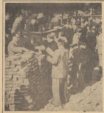
UCZESTNICY niedzielnego zjazdu w Starogardzie — działacze Komitetu Odbudowy Warszawy w naszym województwie usiłąli również udełnić w obrzydzeniu Starogardu. Cegły szły do Warszawy, a więc każdy pracował chętnie. (Patrz artykuł na str. 3).