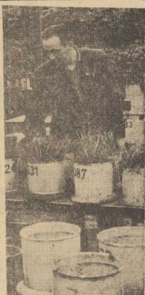
POMYSŁNY przebieg doświadczeń w dużej mierze zależy od stajek obserwacji i ostrożnej kontroli. Na zdjęciu pracownik Ośrodka Rolnego im. Nowak bada rozwój traw.