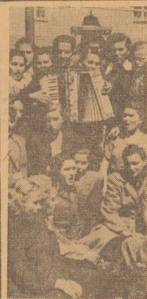
Z RADOŚCIĄ wyjeżdża młodzi woj. szczeciński na ochotniczo brygady „SP”. W o-miesięcznych brygadach dziewczęta uczyć się będą zawodu i jednocześnie pomagać spółdzielcom produkcyjnym oraz PGR-om woj. gdańskiego i wrocławskiego w pracach rolnych. W oczekiwaniu na wyjazd jest jeszcze wiele czasu, aby zwiędzić miasto i jego zabudki, nawzajem ze sobą pierwszą zważoność i wspólnie pośpiewać.