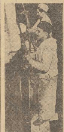
SZCZURY ładowe zachycują się już z daleka olśniewającą bielą bark „Daru Pomorza”. Najczęściej jednak nie dają sobie sprawy, że ta biel centymetr za centymetrem kwadratowym wylania się spod pedali w rękach młodej zalogi „Daru”. Przystał ofierowie muszą poznać wszystkie roboty pokładowe.

A NAS to dziwi? Ani — ani! Czy zwac się ma „republikanin”, Czy „demokrata” — zawsze proście! Powiedzieć o nim: WROG LUDZKOŚCI.