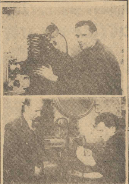
Dla uczczenia 10 rocznicy powstania PPR

„Polacy wam podają rękę” — pisał Tadeusz Kościuszko przed 150 lat. Ale dopiero w Konstytucji Polskiej Ludowej mogło się znaleźć prawo, które oznacza nie na papierze, lecz w rzeczywistości — pomocą dłoń dla bojowników wolności.