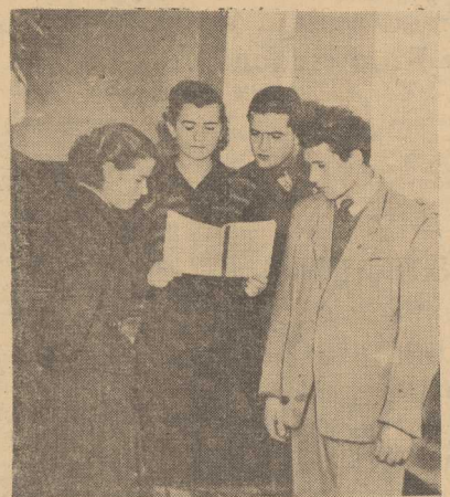
ART. 61 projektu Konstytucji Polskiej Rzeczypospolitej Ludowej.

W sesji udział weźmie społeczeństwo miasta Szczecina i wojewódzwa