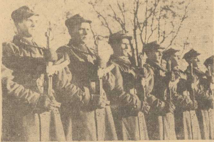
FRAGMENT msztry młodego rocznika.