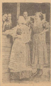
CZŁONKOWIE zespołu „Mazowsze” w Karolinie po powrocie ze Związku Radzieckiego. Dziewczeta oglądają piękny moskiewski stroj regionalny otrzymany w prezencie od zespołu im. Piatińskiego w Minsku.

50-lecie urodzin Malenkowa Depesze gratulacyjne od przewodniczącego KC PZPR Bolesława Bieruta i premiera Cyrankiewicza