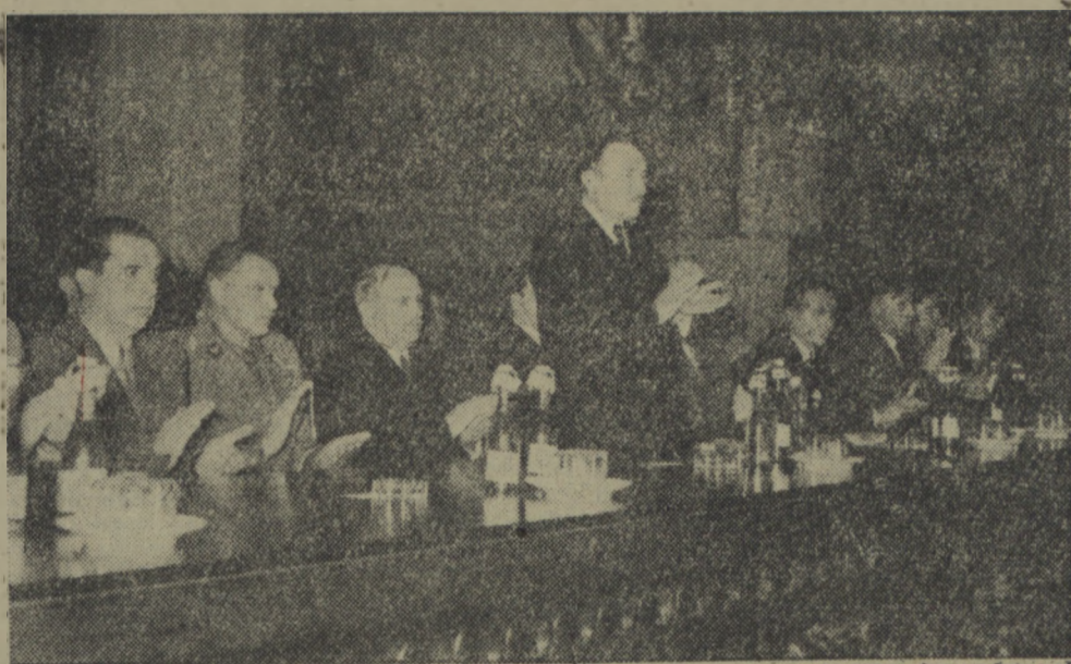
Dnia 31 października 1952 r. w sali Rady Państwa w Warszawie odbyło się rozszerzone posiedzenie plenarne Ogólnopolskiego Komitetu Frontu Narodowego. Na zdjęciu: Prezydent Bolesław Bierut otwiera posiedzenie.

Cena 15 gr Koszalin, środa, dnia 5 listopada 1952 r. Rok I Nr 57