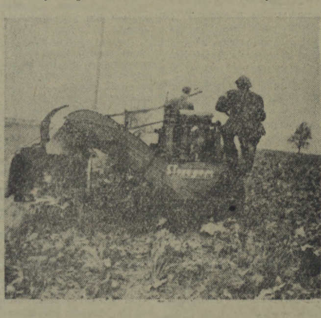
W całym kraju trwają intensywne prace związane z wykopkami buraków cukrowych. W dużej mierze tempo prac przyspieszają kombajny buraczane dostarczane nam, w ramach wymiany towarowej, przez Związek Radziecki. Na zdjęciu: Radziecki 1-tygodniowy kombajn do buraków cukrowych, który wykopuje dziennie buraki z 1,5 ha obcinając jednocześnie liście i układając ogłowione buraki na osobne rzędy. Traktor i kombajn obsługują pracownicy PGR.