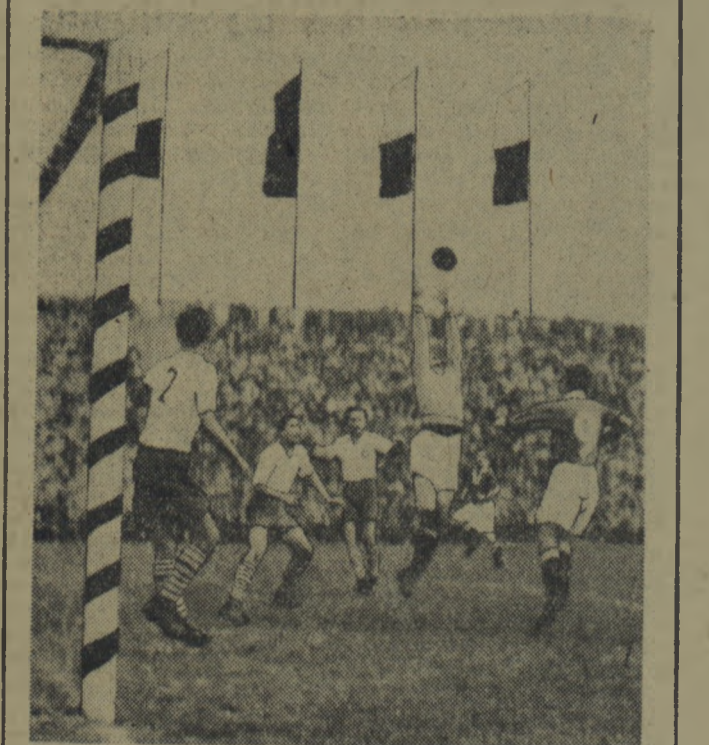
W dniu 21 września 1952 r. rozegrano w Warszawie pierwszy międzypaństwowy mecz piłkarski pomiędzy reprezentacją Niemieckiej Republiki Demokratycznej, a Polską. Mecz zakończył się zasłużonym zwycięstwem Polski w stosunku 3:0. Na zdjęciu fragment meczu Foto CAF

18 rzut rozgrywek piłkarskich o mistrzostwo II Ligi przyniosł dalsze zwycięstwo dobrze finiszującej Gwardii słupskiej. Pokonała ona w ub. niedzielę w Toruniu miejscowego Kolejarza 4:1. A oto wyniki pozostałych spotkań I grupy: Kolejarz Bydgoszcz — Gwardia Szczecin 4 0 (2:0) Kolejarz Leszno — Gwardia Bydg. 1:2 (1:1) Kolejarz Gdańsk — Stal Gdańsk 2:4 (1:2) Stal Poznań — OWKS Bydgoszcz 0:1 (0:1) TABELKA Gwardia Bydg. 17 24 31:20 OWKS Bydg. 16 23 34:15 Kolejarz Leszno 17 19 31:25 Stal Poznań 17 10 29:26 Kolejarz Toruń 18 18 29:27 Stal Gdańsk 18 18 34:41 Kolejarz Bydg. 18 17 28:32 Gwardia Słupsk 16 16 37:33 Gwardia Szcz. 18 13 26:34 Kolejarz Gdańsk 17 5 24:46