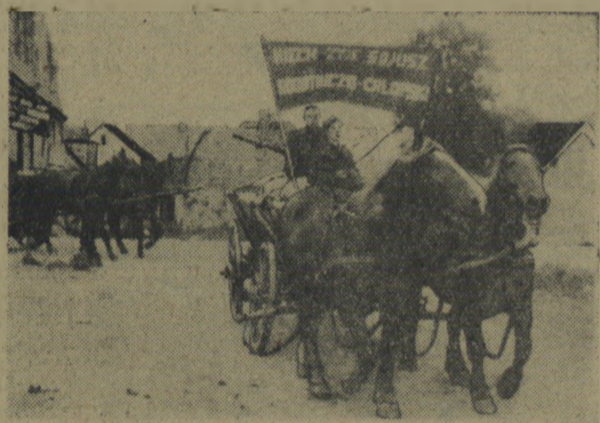
Spółdzielcy z Milenka pow. drawski realizując swój czyn przedwyborczy radośnie i manifestacyjnie wiozą zboże do punktu skupu.

Ogółem zapowiadzieli swój udział w Kongresie przedstawiciele 32 krajów.