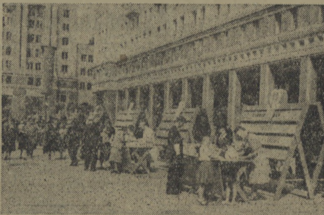
Na placu Konstytucji w Warszawie, w pierwszych dniach nowego roku szkolnego, zorganizowano wielki Jarmark Szkolny. Podręczniki szkolne, materiały piśmienne i galeria szkolna znajdowały tysiące nabywców.

Gdy budowniczości Warszawy zrealizują Plan 6-letni, śródmieście stanie się centrum życia politycznego, gospodarczego i społecznego. To tu, dzięki radzieckim przyjaciółom, budowniczym najpiękniejszego gmachu miasta, w głównym Pałacu Kultury i Nauki, którego strzelistą sylwetką przetrnie panoramę Warszawy, zogniskuje się życie naukowe i kulturalne, nie tylko socjalistycznej, robotniczej stolicy, ale całego narodu, przekształcającego się w naród socjalistyczny.