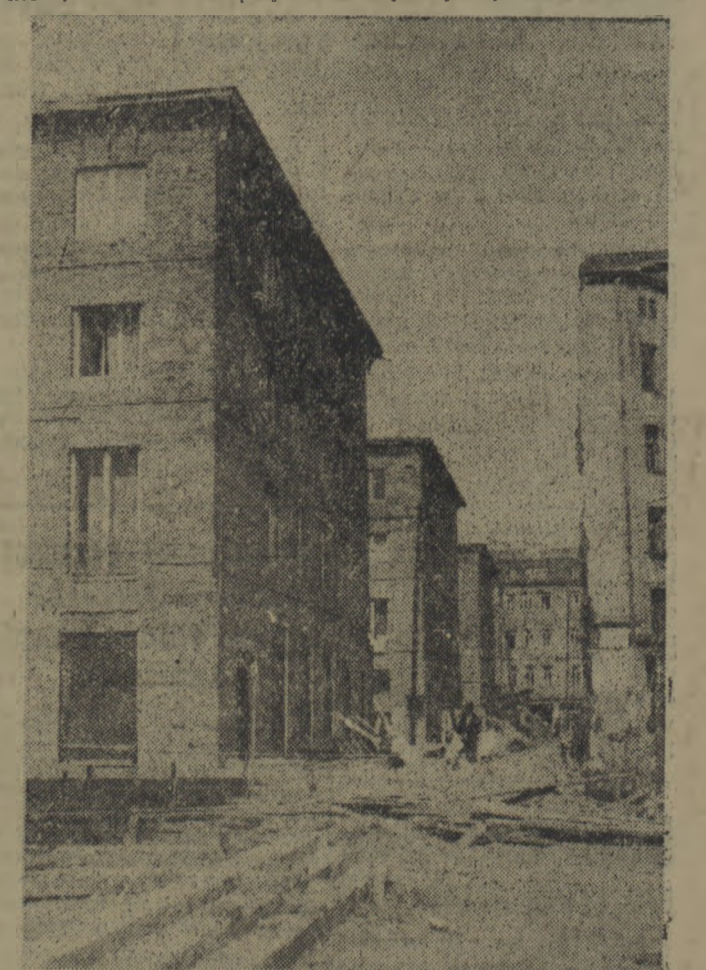
W Warszawie na zapleczu ulicy Nowy Świat buduje się tzw. ciąg pieszki. Na zdjęciu: Fragment budowy ciągu pieszkiego między ul. Foksal a ul. Ordynacką.

Jednak budowa warszawskiego przemysłu, przemysłu o wysokiej kulturze technicznej, choć niezmiernie doniosła, nie wyczerpuje zadań, stojących przed budowniczymi socjalistycznej stolicy. Ludność Warszawy, warszawska klasa robotnicza, musi coraz lepiej mie-