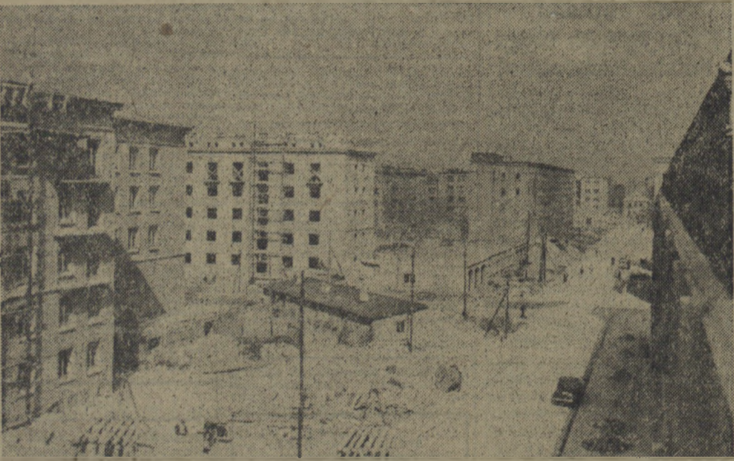
W miesiącu budowy Stolicy znacznie wzrasta tempo prac budowlanych w Warszawie. Z każdym dniem przybywają nowe mieszkania dla świata pracy. Na zdjęciu: Fragment osiedla mieszkaniowego Muranów. Widok wzdłuż ulicy Nowolipie.

Bo proletariatu Warszawy rósł w siłę... Pomny tradycji rewolucyjnych walk Waryńskiego i Dzierżyńskiego, pod czerwonymi sztandarami wdzierał się coraz częściej w pierwszomajowych pochodach w wyleknione ulice śródmieścia. Manifestował swą zwy-