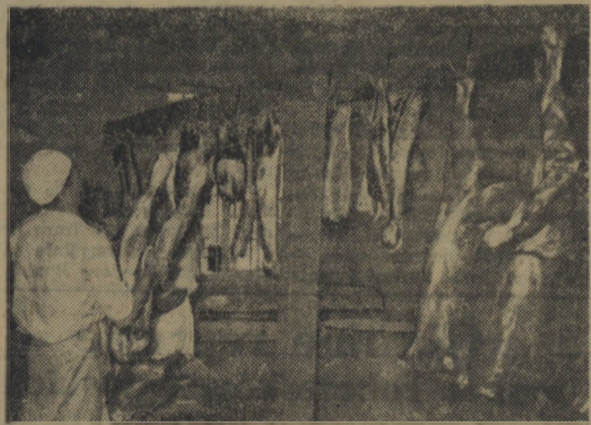
Spółdzielczość samopomocowa, stanowiąca tak ważne ogniwo w umocnieniu spójności między miastem i wsią, coraz bardziej rozszerza swój zakres działania. Oprócz licznych placówek zaopatrzenia i skupu prowadzą Gminne Spółdzielnie zakłady przemysłowe i usługowe.