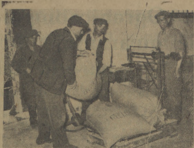
W coraz szybszym tempie rozwija się akcja dostaw zboża dla Państwa. Liczne gospodarstwa, w miarę jak kończą sprząć zboża i przeprowadzają omloty, zwiększają dostawy zboża do punktów skupu. Na zdjęciu: Przyjmowanie zboża od chłopów gospodarujących indywidualnie w magazynie Gminnej Spółdzielni w Proszowicach.

Dożynki odbędą się w dniach 15-iej rocznicy strajku chłopskiego w 1937 roku, który był wielkim rewolucyjnym zrywem masy zbitego, wyzwanego z ziemi i praw obywatelskich chłopstwa pracującego — przeciwko obszarznikom i kapitalistom, przeciwko faszystowskiemu rządowi sanacji.