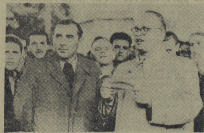
— Przyjechaliśmy do Was — to nasze Odrodzone Wojsko Polskie. — powiedział on, m. in. — aby