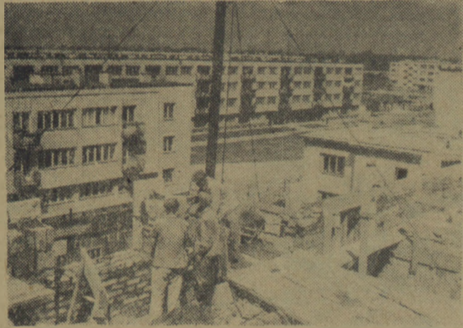
Na zdjęciu: Murarze z grupy Mieczysława Wolframa przy budowie VI bloku osiągnęli 195 proc. normy.

BUDOWA OSIEDLA MIESZKANIOWEGO NA KOLE W WARSZAWIE POSTĘPUJE SZYBKO NAPRZÓD