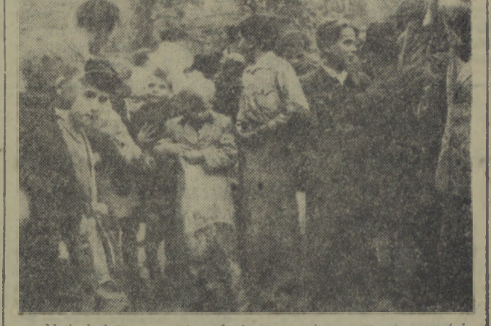
Najmłodsi uczestnicy festynu poświęcają się „wypici gumy w workach”. Życiocy otrzymali piękne książki.