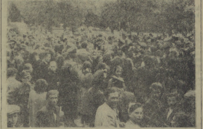
Pod występach zespołów śpiewających wszyscy bawili się wesoło do późnego wieczora przy dźwiękach doskonałej orkiestry.

W sobotę wieczorem w parku koszalińskim odbył się wielki Festyn Ludowy zorganizowany przez redakcję „Głosa Koszalińskiego” wspólnie z Wojewódzkim i Miejskim Komitetem obchodu Świąt, Książki i Pracy.