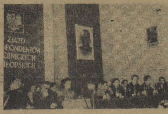
W Prezydium Zjazdu zasiadli obok przedstawicieli Partii, władz terenowych, kierownictwa Redakcji obu gazet szczecińskich i Radia oraz przybyłych na Zjazd delegatów z NRD — przewodzący korespondenci robotniczy i chłopski z miast i wsi województwa szczecińskiego. Na zdjęciu: widok prezydium Zjazdu.