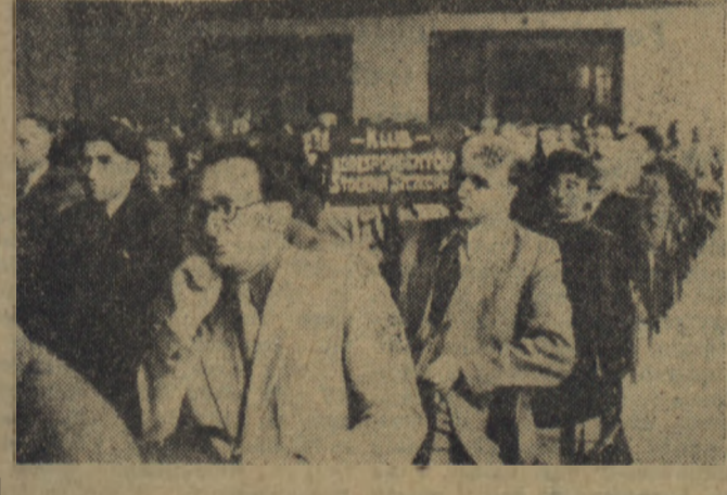
Na sali obrad korespondenci zajmowali miejsca często według poszczególnych zakładów pracy lub wsi, by łatwiej wymieniać uwagi na temat słyszanych przemówień i wypowiedzi w dyskusji. Na zdjęciu, na pierwszym planie — grupa korespondentów ze Stoczni Szczecińskiej.