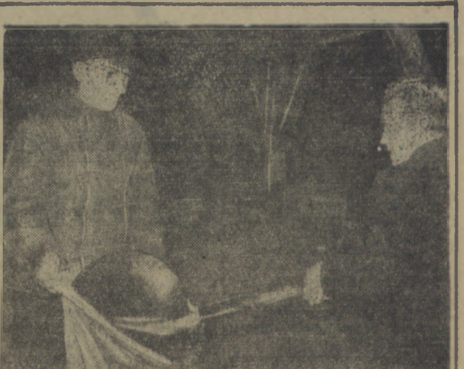
Członkowie spółdzielni produkcyjnej w Mokrem dokonali rocznego obrotu i podzieliли się dochodem uzyskanym w wyniku całorocznej zespołowej pracy.

Władze M. O. w Koszalinie i na terenie innych miast naszego województwa przystąpiły do zdecydowanej walki z chuligaństwem i chuligaństwem wśród kierowców samochodowych.