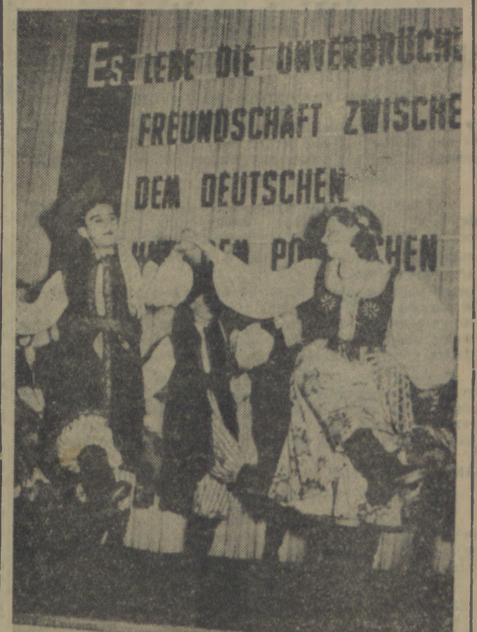
Podczas akademii w Berlinie, poświęconej przyjaźni narodu niemieckiego i polskiego, wystąpił zespół tańeczny Towarzystwa Przyjaźni Niemiecko-Polskiej, który odtńczył polskie tańce ludowe.