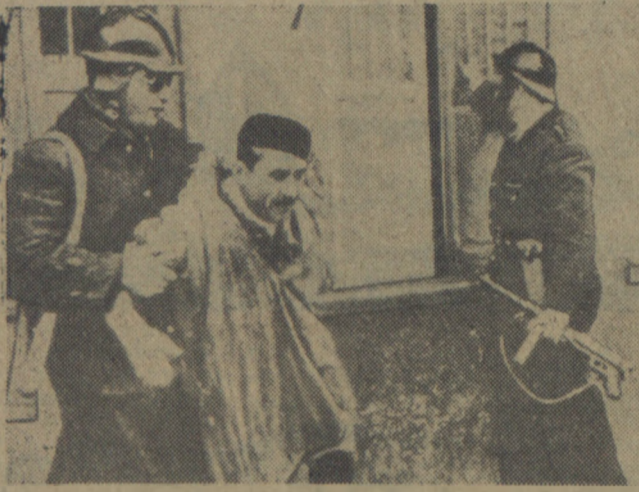
W Tunisie trwa nadal napięta sytuacja. 1 kwietnia br. w całym kraju odbył się powszechny strajk na znak protestu przeciwko polityce kolonizatorów francuskich w Tunisie. Na zdjęciu: patrioci Tunisu zostają aresztowani i osadzeni w obozach.