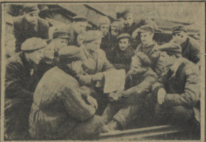
Brigada Rybarskiego zalicza się w Stoczni do brygad produkcyjnych. Członkowie tej brygady są świadomi swych zadań i dlatego potrafią skutecznie walczyć o ich realizację. W trosce o codzienne podnoszenie swej świadomości, brygada przeprowadza każdego ranka prace. Czyta się na głos i dyskutuje najważniejsze wiadomości i najciekawsze artykuły. Wydarzenia ogólnokrajowe i o światowym znaczeniu tłumaczy się na codzienny język pracy Stoczni i to pomaga zwyciężać w realizacji odpowiedzialnych zadań produkcyjnych.

Naród polski z radością wita każdy sukces polityczny, gospodarczy i kulturalny naszych przyjaciół na zachód od Odry i Nysy. P. M.