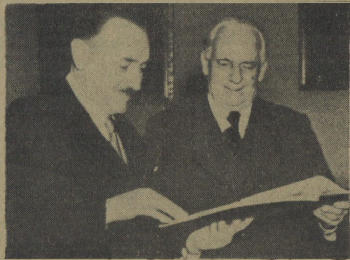
Prezydent RP Bolesław Bierut i Prezydent NRD Wilhelm Pieck.