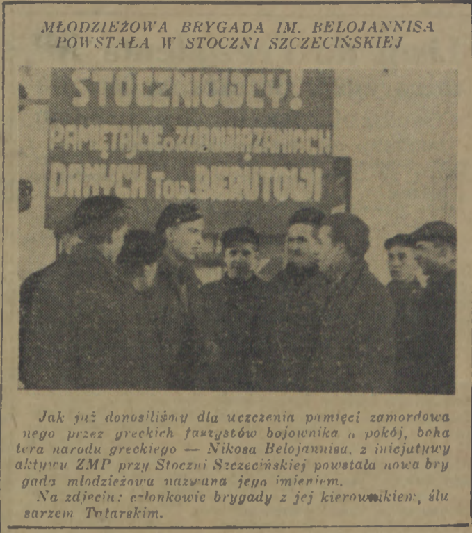
MŁODZIEŻOWA BRYGADA IM. BELOJANNISA POWSTAŁA W STOCZNI SZCZECIŃSKIEJ